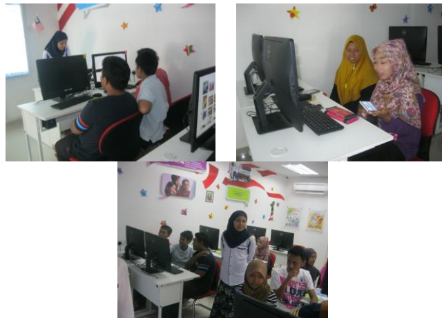
Video Kreatif - Program Literasi Ict & Dashboard Komuniti