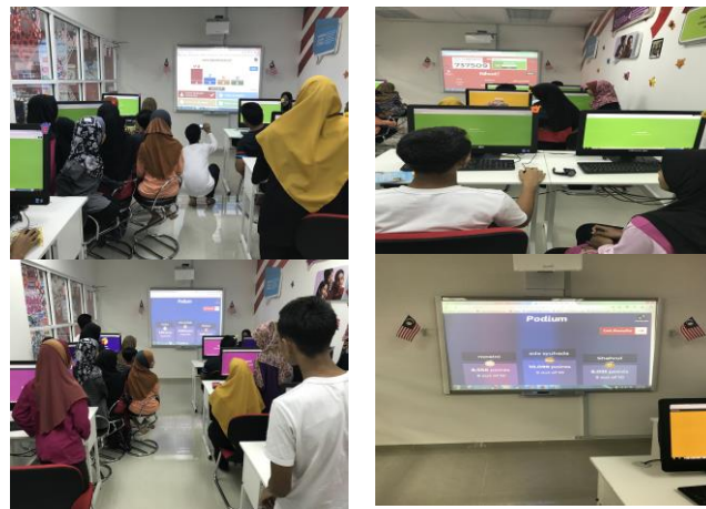
Kuiz Ict Kahoot - Program Literasi Ict & Dashboard Komuniti