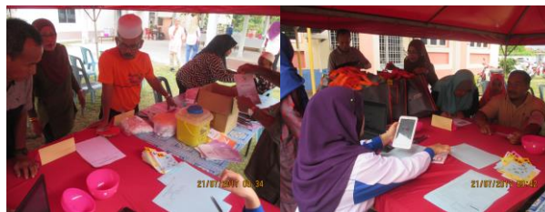
Pemeriksaan Kesihatan I-Health