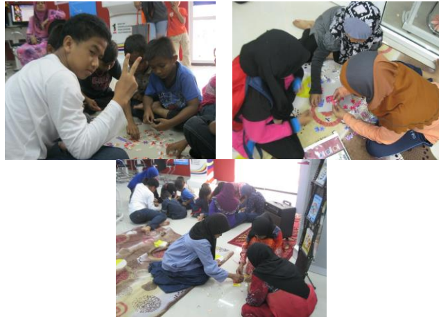
Puzzle Manual Dashboard Komuniti Sempena Program Literasi Ict & Dashboard Komuniti