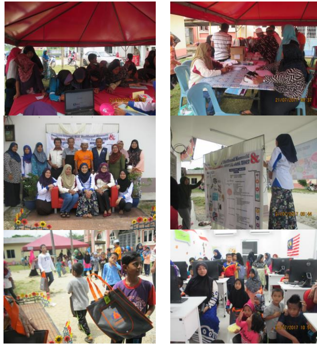
Pengunjung Program Literasi ICT & Dashboard Komuniti 2017