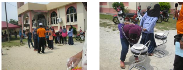
Sukaneka Kanak-Kanak Sempena Program Literasi ICT & Dashboard Komuniti