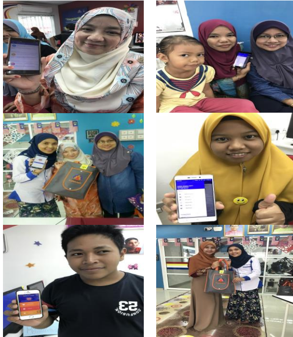
Download Aplikasi Dashboard Melalui Smart Phone