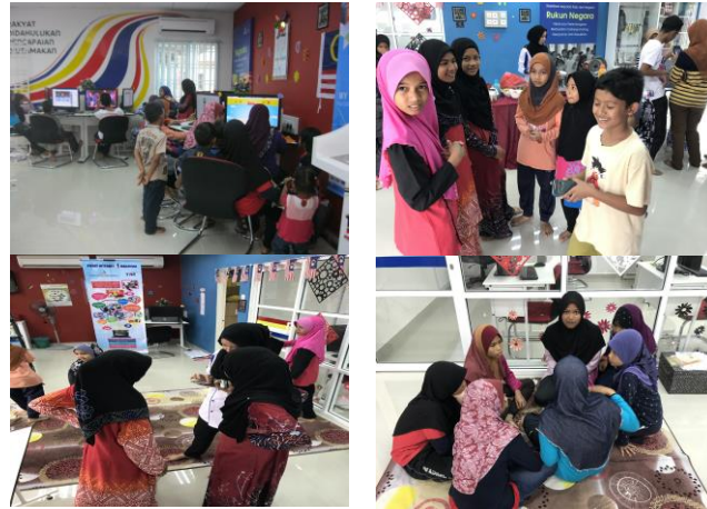
Skrin To Skrin - Program Literasi Ict & Dashboard Komuniti