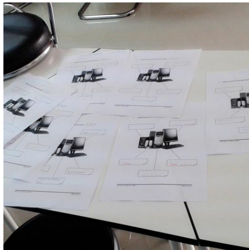
Caption : SOALAN – SOALAN MENGENAI ASAS PERKOMPUTERAN