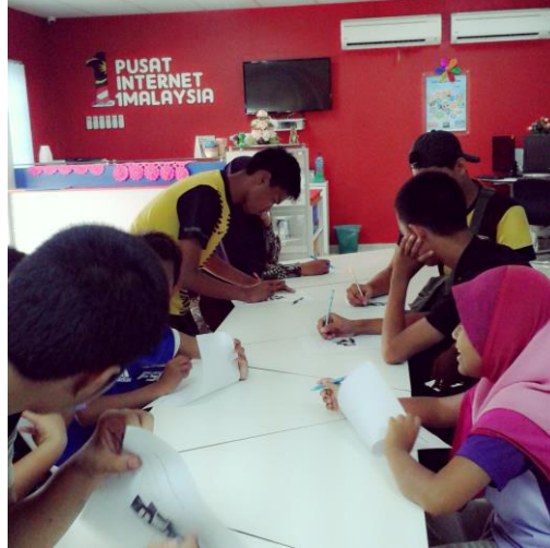
Caption : SESI LATIHAN MENGUJI MINDA